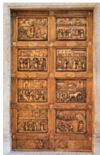
Città del Vaticano, S. Pietro Porta dell'Archivio Segreto Vaticano (m 2 x 3,30) anno 1985.

Li scoprì il meraviglioso mondo della grande arte e se ne innamorò con una passione che non lo ha mai abbandonato. Della vastissima produzione ricordiamo alcune tra le opere più importanti qui non riprodotte: portali di chiese in Alatri, Morolo, Sgurgola, Sora, Monte S. Giovanni Campano, Civitacastellana, Paola, Lanciano e Riese; scultura per la cappella del Beato Angelico - Roma; statua della Madonna a Venado Tuerto - Argentina; Grande Leone di San Marco - Città del Messico; statua di Papa Giovanni Paolo II (1985), statua della Madonna (1987) e statua André Latrille (1986) in Costa d'Avorio; statua Beato L. Ruiz (1981) - Filippine.